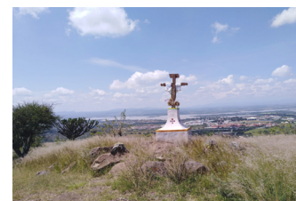
Ilustración 3. El calvario de la Santa Cruz de la Lejona es parte de los itinerarios ceremoniales que tienen su epicentro en el cerro de Las Tres Cruces.

Así, las redes comunitarias se activan integrando, por ejemplo, a los vecinos de Nuevo Pantoja. Este es un asentamiento irregular ubicado ladera abajo, y originado por el desplazamiento forzoso de población para la construcción de la presa Ignacio Allende en el cauce del río Laja en la década de 1960. El proceso de relocalización involuntaria ocasiona la pérdida de tierras de cultivo, viviendas u oficios, y genera un poblamiento no reconocido oficialmente (Trujillo García, 2014). Esto se refleja en el limitado acceso a servicios públicos como el agua potable, sin embargo, el trazo del Acuaférico le atraviesa para proveer de agua y bajar las descargas de los proyectos inmobiliarios que grandes inversionistas erigen cuesta arriba.