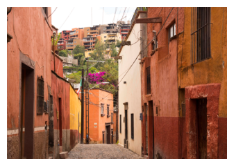
Ilustración 2. Dominando lo alto de la ladera sobre la que se asienta el área inscrita como Patrimonio Mundial, desde 2012 se construye “Capilla de Piedra”, un conjunto de más de un centenar de edificios de departamentos para renta vacacional. En los últimos años aparecen proyectos inmobiliarios similares en las colinas que rodean el Centro Histórico de San Miguel de Allende (Fuente: Elaboración Propia, 2019).