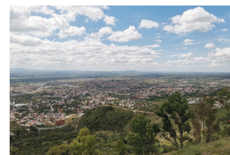
Ilustración 4. Vista panorámica de San Miguel de Allende hacia el norponiente, desde el centro ceremonial del cerro de Las Tres Cruces.