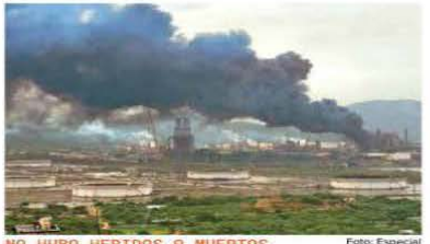
NO HUBO HERIDOS O MUERTOS

doble, que no haya un tradidor. Falta un voto y tenemos que sostenemos", aseveró. Los integrantes de las comisiones de Puntos Constitucionales y de Estudios Legislativos están citados este domingo a las 13:00 horas para aprobar el dictamen. En tanto, el presidente Andrés Manuel López Obrador acusó a la oposición de querer confundir a la población con la reforma judicial, pues aseguró que no causará inestabilidad económica. ¿Por qué no vamos nosotros, también, los ciudadanos, a elegir a los jueces? ¿Cuál es el miedo?", cuestionó desde Tulum. PRIMERA | PÁGINAS 4 Y 5