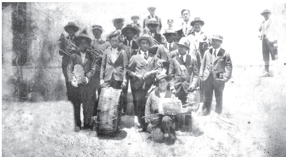
Banda de músicos andinos de Pica, década de 1940 107