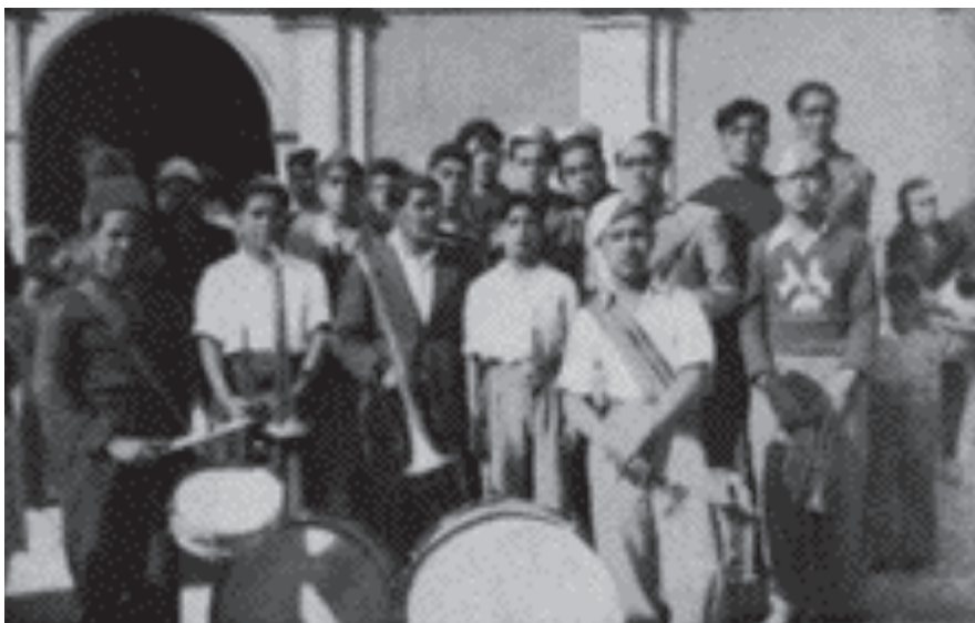
Banda de bronce con músicos andinos en La Tirana (1947) 105