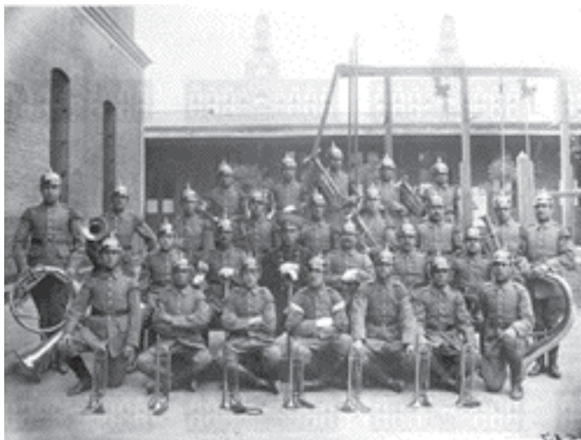
Banda de músicos del regimiento Cazadores N° 2, (comienzos del siglo XX aprox.) 106