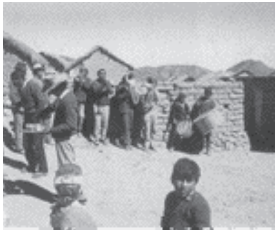
Banda de bronce en la Pachama, interior de Arica (década 1970 aprox.) 104