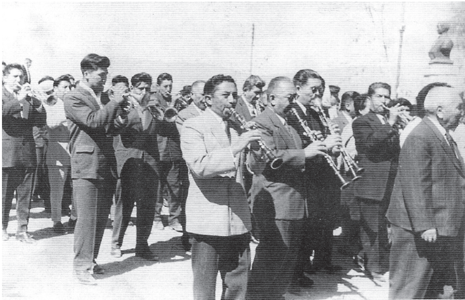
Banda de músicos andinos ex militares, década de 1950 103