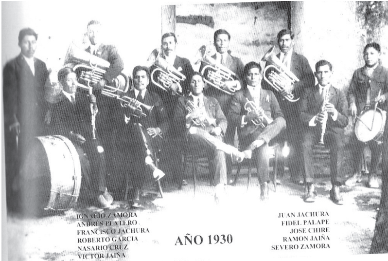
Banda de músicos militares de Guaviña, 1930 98